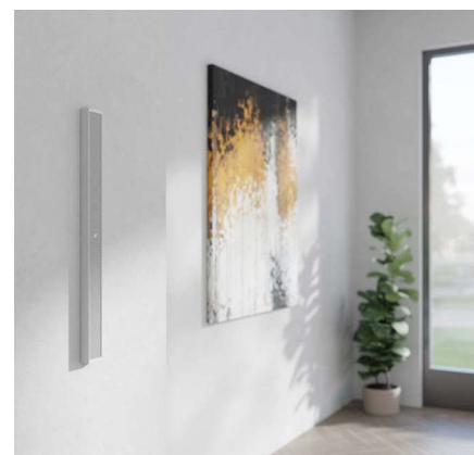
Ob schwarz oder silbern: Die zwei Zentimeter flachen Lautsprecher der Vyper-Baureihe integrieren sich komplett im umgebenden Raum. Neben der 52-cm-Version (im Bild) gibt es Varianten mit 26 und 100 cm Länge

Zu diesen Lautsprechern bietet K-Array exakt abgestimmte System-Amplifier an. Über eine integrierte DSP-Steuerung kann der Klang optimal auf den Raum eingemessen werden. Weiter verhindern Schutzschaltungen die Beschädigung der Lautsprecher, falls der Lautstärkeregel einmal zu viel Leistung in die Leitungen schießt – besonders wichtig bei den sehr kleinen Systemen. Die K-Array-Verstärker bieten eine Vielzahl von Konfigurationen und Funktionen, die es ermöglichen, das Audio-System an die spezifischen Anforderungen anzupassen.