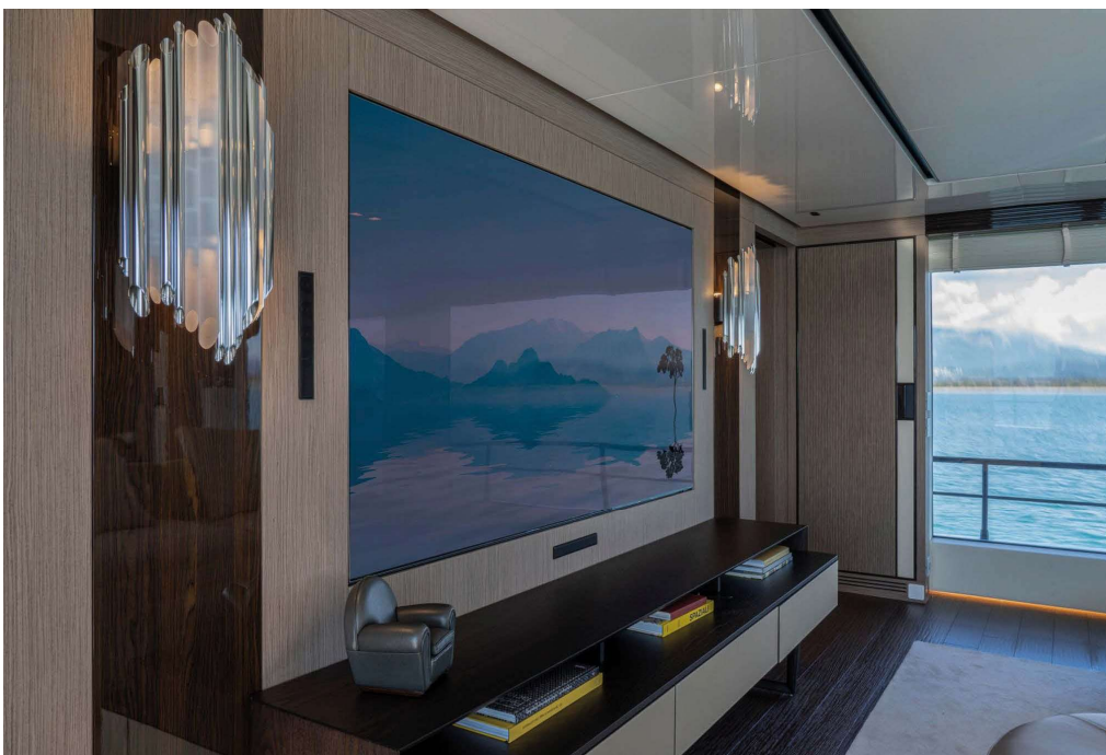
K-Array-Lautsprecher sind auch seefest und daher auch auf luxuriös ausgestatteten Yachten zu finden

lich. Gleichzeitig überstehen sie auch den Einsatz im Freien sowie auf Yachten problemlos. Diese Lautsprecher mit ausgesprochenem Sex-Appeal sind nicht nur ein akustisches Highlight, sondern auch ein optisches Meisterwerk. Das besondere Design und die edlen Materialien machen jeden Lautsprecher zu einem Kunstwerk, das in jedem Raum zum Blickfang wird.